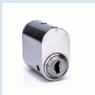
CYLINDER OVAL UTSIDA SSF 1091, 3522 Utgåva 1, Klass 5

Samtliga cylindrar är även brandklassade enligt EN 1634-1:2014 klass EI120. Produkterna möter högt ställda kvalitets- och miljökrav.