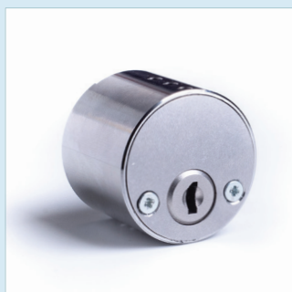
CYLINDER RUND INSIDA SSF 3522 Utgåva 1, Klass 5