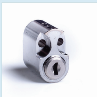
CYLINDER OVAL INSIDA SSF 3522 Utgåva 1, Klass 5