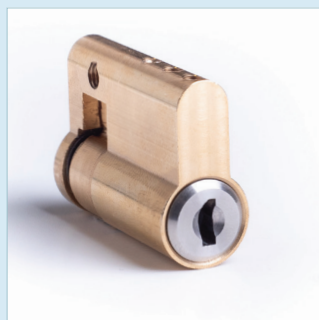
CYLINDER EU-PROFIL SSF 3522 Utgåva 1, Klass 5