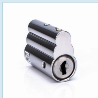
SNOWMAN FÖR HÄNGLÅS SSF 1091 Utgåva 1, Nivå 5