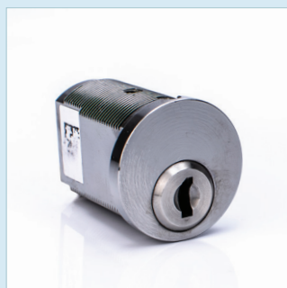
INDUSTRICYLINDER LARGE SSF 3522 Utgåva 1, Klass 5