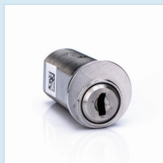
INDUSTRICYLINDER SMALL SSF 3522 Utgåva 1, Klass 5