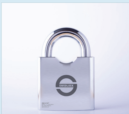
HÄNGLÅS 840-4 WP