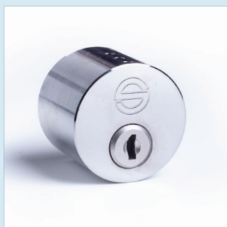
CYLINDER RUND UTSIDA SSF 3522 Utgåva 1, Klass 5